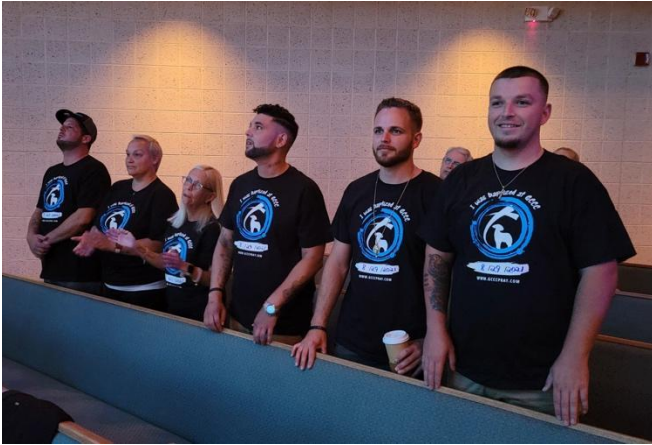
ILUSTRACIÓN : Durante el último año y medio, Chain Breakers, a pesar de las restricciones de COVID, salió de la casa y llevó el EVANGELIO

Breakers, luego camine junto a ellos hasta que se sientan cómodos y hayan encontrado un hogar.